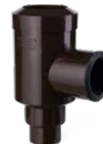
50/50 - 63/50