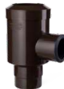
75/50 - 80/50