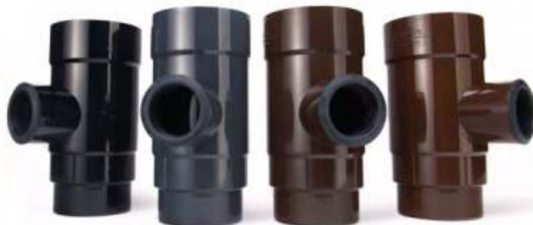
110/50 - 90/50